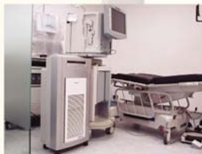
"innoclean" 400A 及 300A 在手術室內使用